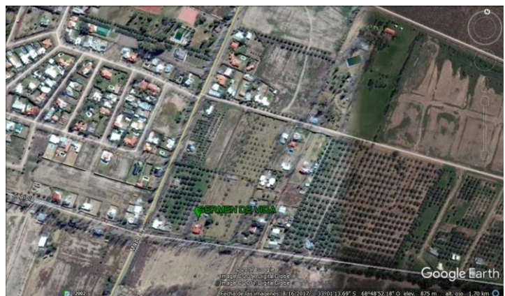
Figura 2- Localización del emprendimiento Germen de Vida