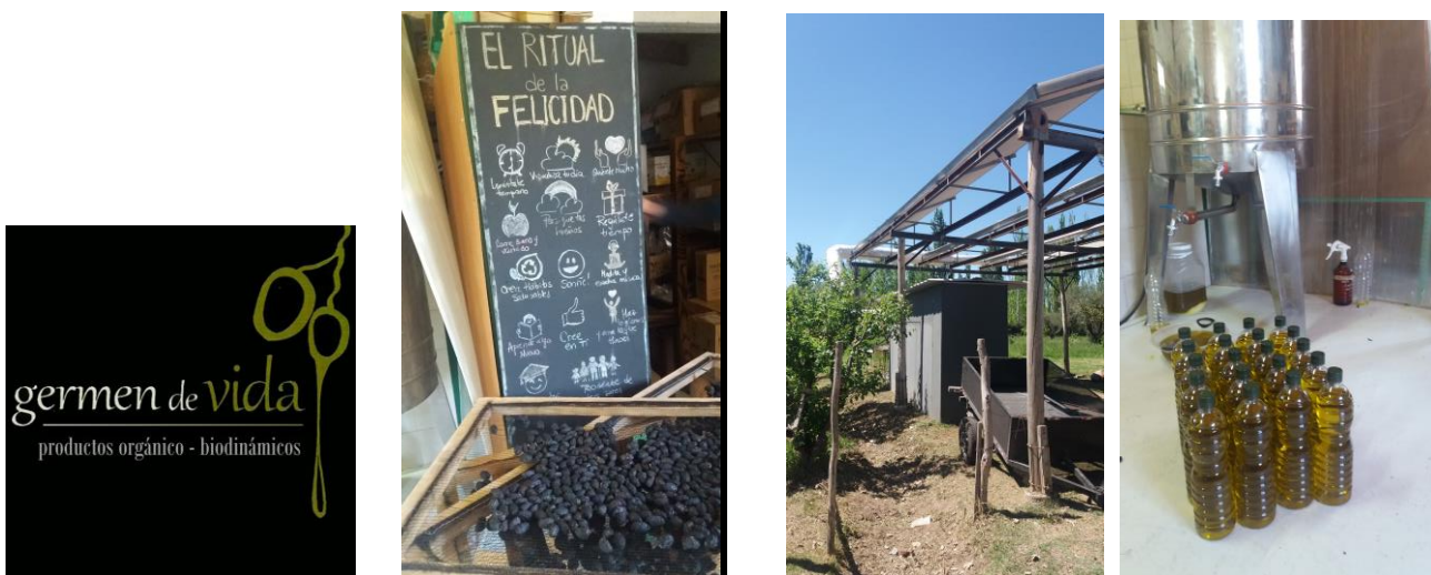
Fig. 3- Imágenes representativas del emprendimiento.

La producción está certificada, desde el 2012, por la OIA (Organización Internacional Agropecuaria) bajo la categoría de Producción Orgánica, sus principales productos son: aceitunas, para conserva y aceite de oliva; peras y ciruelas para néctar y mermeladas; almendras, y dentro de las hortalizas: tomates, para consumo en fresco, para puré y deshidratar, en el recién inaugurado horno solar; zapallo y batata; también poseen algunas hectáreas cultivadas con vid para consumo en fresco, y recientemente han plantado nogales en una de las fincas de Junín.